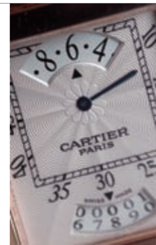
面盤上方以24小時制的數字顯示小時，日期窗在下方，兩位數字的日期上下排列，相當的特別。