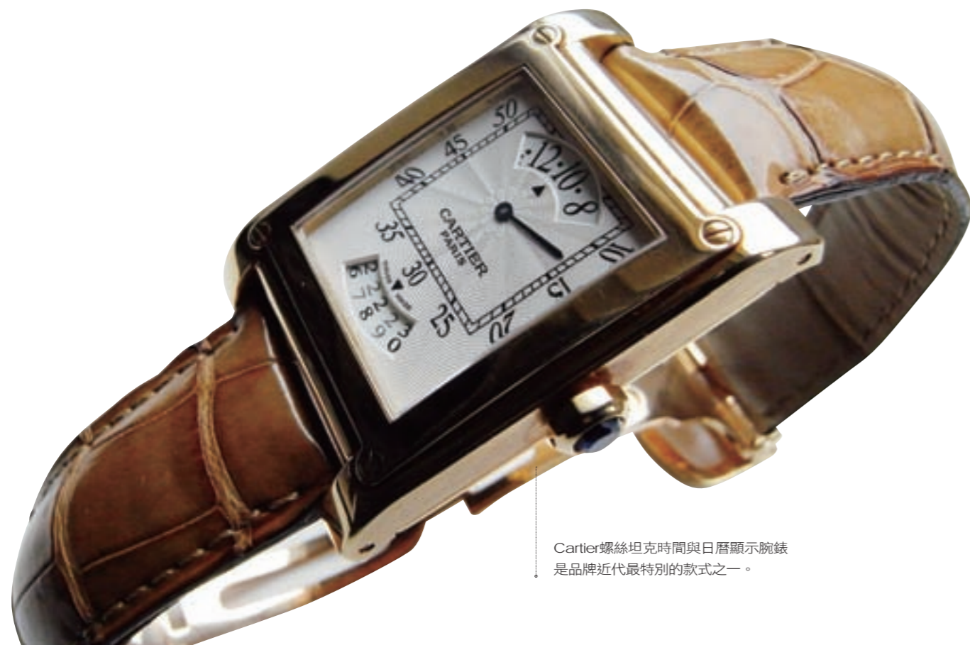
Cartier螺絲坦克時間與日曆顯示腕錶是品牌近代最特別的款式之一。