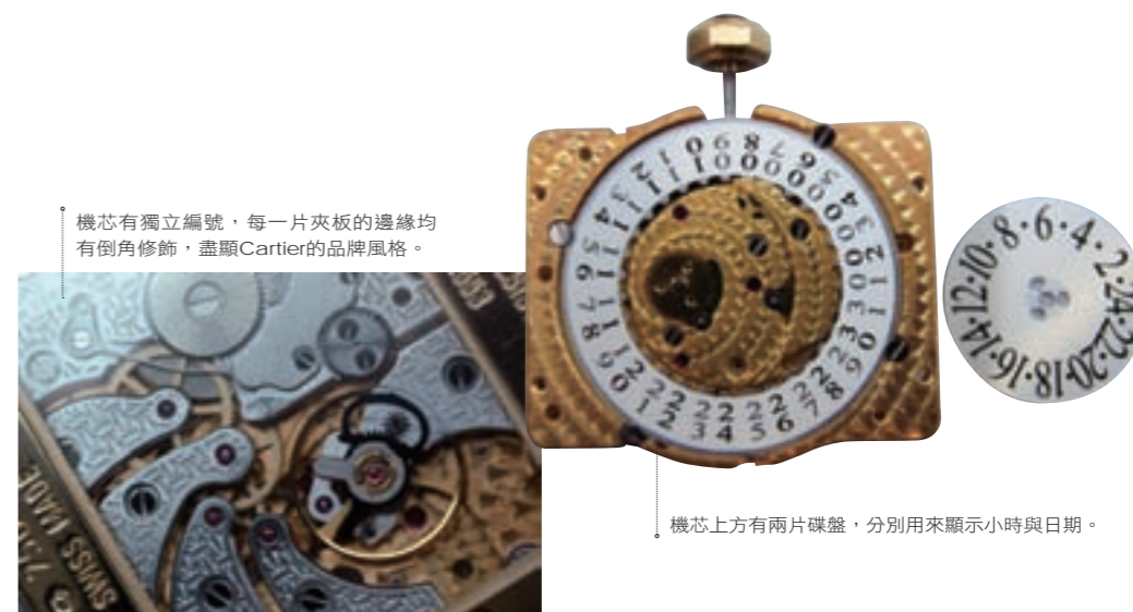
機芯有獨立編號，每一片夾板的邊緣均有倒角修飾，盡顯Cartier的品牌風格。

2009年Cartier進入了另一個新的領域，首席機芯設計師Carole Forestier-Kasapi入主，品牌推出Fine Watchmaking高級製錶系列，邁向高級腕錶的研發與生產，並且每一年都研製推出最高規格的款式，也因此停止了CPCP系列的生產。其中有兩款最引人矚目，分別是2015年的Ronde de Cartier大型複雜功能超薄鏤空腕錶，機芯厚度僅5.49毫米，卻是一只擁有日內瓦印記的三問報時、陀飛輪與萬年曆自動上鍊錶。而2017年同樣有日內瓦印記的Ronde de Cartier則是將三問與雙重神秘陀飛輪兩者渾然融合的複雜腕錶，展現了品牌深厚的技術底蘊與神秘美學，從此也讓Cartier成為可以生產頂級珠寶、頂級珠寶腕錶與複雜功能腕錶的完全品牌。